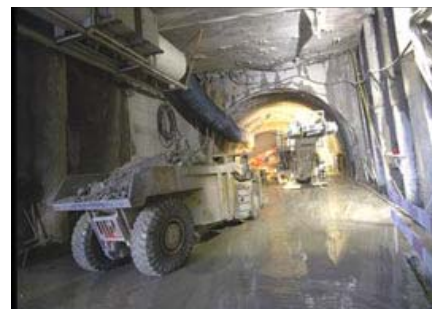
Front Tunnel Perdonnet